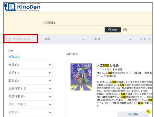
所蔵タイトルのみ

検索後に表示される項目「未所蔵を含める」にチェックを入れると、本学にない電子書籍についても、内容紹介を確認し、試し読みをすることができます。