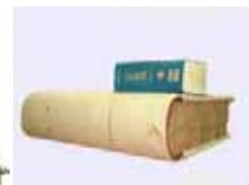
日本郵船株式会社『金銀出納帳』