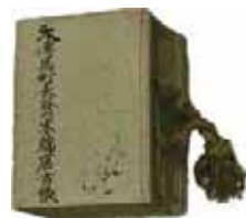
大伝馬町木綿店仲間文書差引帳